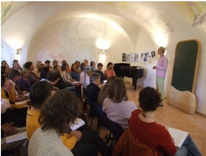
Heinz Grill während der Moderation

Der Mensch besitzt die Möglichkeit, beispielsweise durch das Denken von Gedanken einer Form oder einem Kunstwerk etwas hinzuzugeben. Dies ist ein gedanklich-geistiger Prozess, der als das Geistselbst, als manas oder die imaginative Stufe bezeichnet werden kann. Was geschieht nun mit den bisher geschaffenen Räumen, wenn ein Mensch auf diese Art tätig wird? Es entsteht etwas Neues, das Alte bleibt nicht Altes. Weil eine geistige Arbeit, eine künstlerisch-geistige Arbeit stattfindet, verändert sich damit der äußere Raum. Und man sieht, dass dadurch etwas entsteht, das als ein Ausdifferenzieren bezeichnet werden kann. Das, was so ganz fest ist, differenziert sich langsam aus und man kann es bezeichnen, dass es im Raum etwas freundlicher und heller wird, dass er ganz leicht zu strahlen anfängt. Da beginnt durch die Arbeit des Menschen plötzlich etwas hinzuzukommen. Zu der bisherigen Architektur kommt tatsächlich etwas hinzu. Eine Form oder ein ganzer Raum geht etwas mehr in einen Aufbau über. Der Mensch beginnt gewissermaßen die Architektur oder andere Kunstwerke oder andere Menschen – es ist immer ein universaler Prozess – zu beleben und lebendige Ätherkräfte aufzubauen. Der schöpferische Prozess im christlich-geistigen Sinne ist eigentlich immer ein Begegnungsprozess, ob er nun mit der Materie direkt oder mit dem Menschen stattfindet. Der Mensch lernt, in eine nächst höhere Ebene zu kommen und einzudringen.