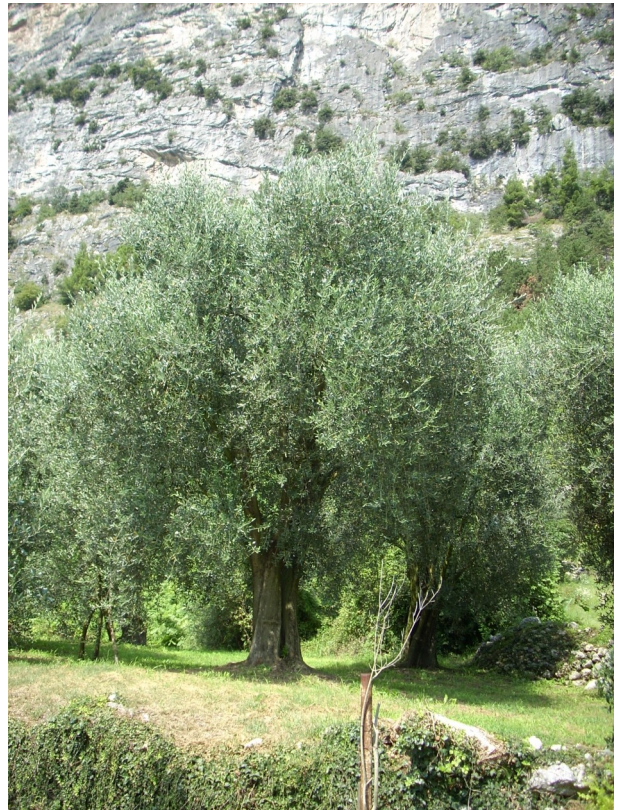
Olivenbaum und Felswand in Dro

den, eine deutliche Belebung des Tourismus im Sarcatal hervor, die das Städtchen Dro, das bisher immer im Schatten von Arco gestanden ist, deutlich zu spüren bekam.