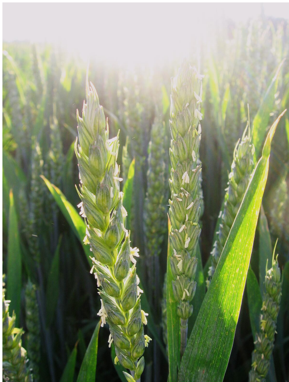
Foto: blühender Weizen

Während die Lichtkräfte beim Wachsen der Getreidepflanze hereinwirken, findet das eigentliche Lichtätherwirken seinen Ausdruck in der fein durchformten Blüte und seiner Bestäubung. Die Staubgefäße der Blüten hängen an einem feinen Faden und fallen in ihrer farblosen Transparenz kaum auf. Nach der Bestäubung erfolgt die Reifebildung, bei der das Wärmeelement überwiegt.