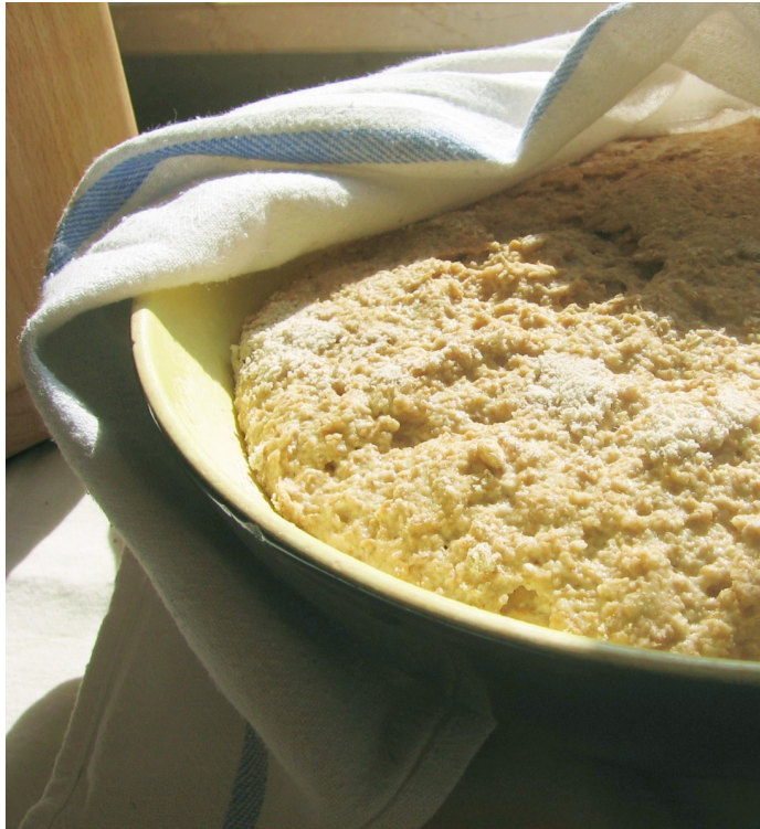
Foto: Vollkorn Brotteig in der Gare

Der Mensch „wirkt“ durch seine mentale Haltung im Brotbereitungsprozess auf das Backergebnis ein. Mit der Milchsäuregärung wird ein lichtfördernder Prozess beschrieben. Wobei die Milchsäuregärung mehr dem chemischen Äther zugeordnet ist. Der Milchsäurevorgang wird als ein starker Verwandlungs- und Aufbauprozess gesehen, der das Getreide auf eine höhere Stufe (Anm.: zum Lichtäther hin) bewegt, das Getreide noch einmal durchformt und durchlichtet.